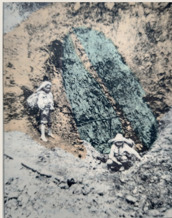
Fig. 3. Afloramiento de la veta Santa Isabel en la orilla meridional de la quebrada del Picacho

Esta Compilación de los estudios geológicos oficiales en Colombia 1917 a 1933 2 , (Tomo I) informes relativos a los trabajos verificados por la Comisión Científica Nacional, bajo la dirección del profesor doctor Roberto Scheibe recoge pues, los estudios e informes realizados durante los años de permanencia de este importante profesor de mineralogía en nuestro país. Dicha compilación reúne de forma detalladas las observaciones en informes sobre yacimientos de carbón en Cundinamarca (municipio de Zipaquirá), así como los resultados de investigaciones en campo Girardot y Nemocón. Cabe resaltar igualmente, la Geología del sur de Antioquia , donde aborda aspectos relacionados con las rocas sedimentarias y los conjuntos de las rocas